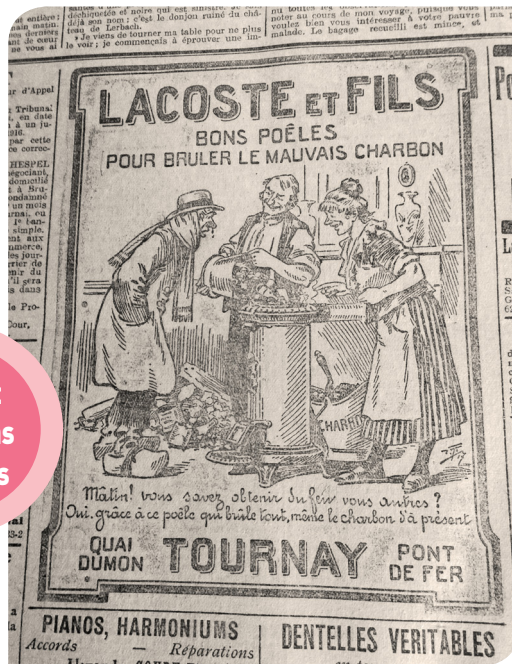
Des « réclames » étonnantes au détour des pages.